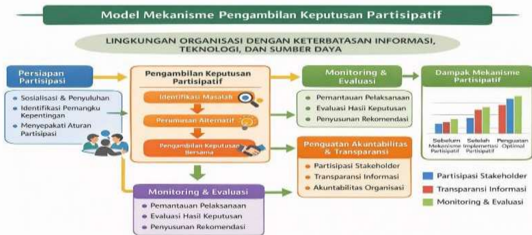
Gambar Diagram 3

Hasil penelitian menunjukkan bahwa penerapan mekanisme pengambilan keputusan partisipatif memberikan peningkatan yang signifikan terhadap indikator partisipasi stakeholder, transparansi informasi, serta sistem monitoring dan evaluasi organisasi. Sebelum penerapan mekanisme partisipatif, tingkat partisipasi pemangku kepentingan masih berada pada kategori rendah dengan skor rata-rata di bawah 2,5. Setelah implementasi mekanisme partisipatif melalui forum musyawarah, konsultasi pemangku kepentingan, serta penyampaian informasi secara terbuka, terjadi peningkatan skor hingga kisaran 3,0–3,8. Pada tahap penguatan optimal, indikator transparansi dan akuntabilitas menunjukkan peningkatan yang lebih signifikan dengan skor rata-rata di atas 4,0. Temuan ini menunjukkan bahwa keterlibatan pemangku kepentingan dalam proses pengambilan keputusan mampu meningkatkan keterbukaan informasi serta efektivitas sistem monitoring dan evaluasi organisasi.