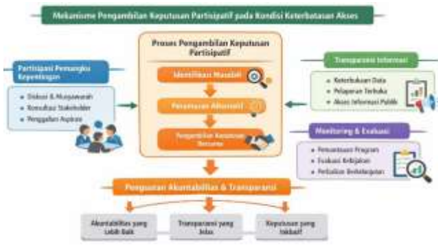
Gambar Diagram 1