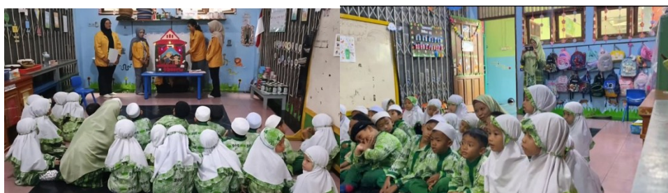
Gambar 2. Perspektif Guru PAUD tentang Pentingnya Pengenalan Profesi bagi Anak Usia Dini

G1 menyatakan bahwa “pengenalan profesi membantu anak mengenal berbagai pekerjaan di sekitarnya serta memahami aktivitas yang dilakukan oleh orang-orang di lingkungan mereka. G2 menambahkan bahwa “ pengenalan profesi juga berperan dalam mendukung proses sosialisasi anak, karena melalui pemahaman terhadap berbagai peran sosial, anak belajar berinteraksi dan memahami fungsi individu dalam kehidupan bermasyarakat”. Sejalan dengan itu, G3 mengungkapkan bahwa “ pengenalan profesi penting agar anak mengetahui berbagai macam profesi yang ada di lingkungan sekitar, terutama yang dekat dengan kehidupan sehari-hari anak.” Lebih lanjut, G4 menyampaikan bahwa pengenalan profesi, anak mulai membangun gambar tentang cita-cita serta memahami bahwa setiap pekerjaan memiliki peran penting dalam kehidupan.” Sementara itu G5 menjelaskan “ sebelum dikenalkan berbagai jenis profesi, banyak anak belum mampu menyebutkan cita-cita yang ingin dicapai, namun setelah diperkenalkan, anak menjadi lebih memahami pilihan dan mampu menyebutkan profesi yang diinginkan. Berdasarkan temuan penelitian tersebut, pengenalan profesi berperan dalam memperluas wawasan sosial anak serta mendukung perkembangan gambaran tentang cita-cita dan pemahaman awal mengenai peran sosial dalam kehidupan bermasyarakat. Namun, implementasinya masih cenderung pada tahap pengenalan dasar dan belum terintegrasi secara sistematis dalam pembelajaran.