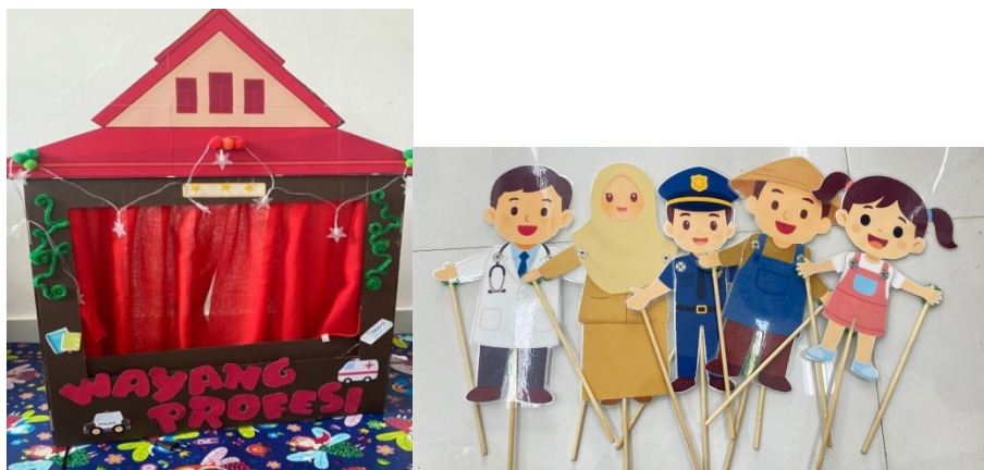
Gambar 3. Media Pembelajaran Boneka Wayang Profesi

sehingga mereka lebih fokus dalam mengikuti kegiatan pembelajaran.” G3 mengungkapkan bahwa “boneka wayang dinilai efektif karena anak mengenal secara langsung bentuk dan karakter boneka tersebut, sehingga mampu menarik perhatian dan meningkatkan ketertarikan anak dalam mengikuti kegiatan pembelajaran.” Selain itu, G4 menjelaskan bahwa “boneka wayang sebagai media yang bersifat tradisional tidak hanya berfungsi sebagai alat bantu belajar, tetapi juga memiliki tujuan untuk menanamkan serta menumbuhkan rasa cinta terhadap budaya Indonesia sejak usia dini”. Sejalan dengan itu, G5 menyatakan bahwa “penggunaan boneka wayang juga dapat mendorong anak untuk berimajinasi dan berpartisipasi aktif dalam kegiatan bercerita”. Berdasarkan temuan penelitian tersebut, penggunaan boneka wayang tidak hanya berfungsi sebagai media untuk menarik perhatian anak, tetapi juga mendukung pengembangan imajinasi, keterlibatan aktif, serta penanaman nilai budaya.